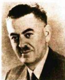
Prof. dr. Ante Šercer

Prof. Šercer (1896. - 1968.) jedan je od najvećih hrvatskih kliničara starije ge- neracije. Zastupao je operativni pristup hipofizi kroz nos, proučavao je sklerom, bavio se otosklerozom (četvrti u Europi izveo je fenestraciju labirinta), istraživao je odnos uspravnog stava čovjeka i savija- nja lubanjske baze, otkrio je nazotorakalni refleks. Bio je prvi liječnik koji je u našu kli-