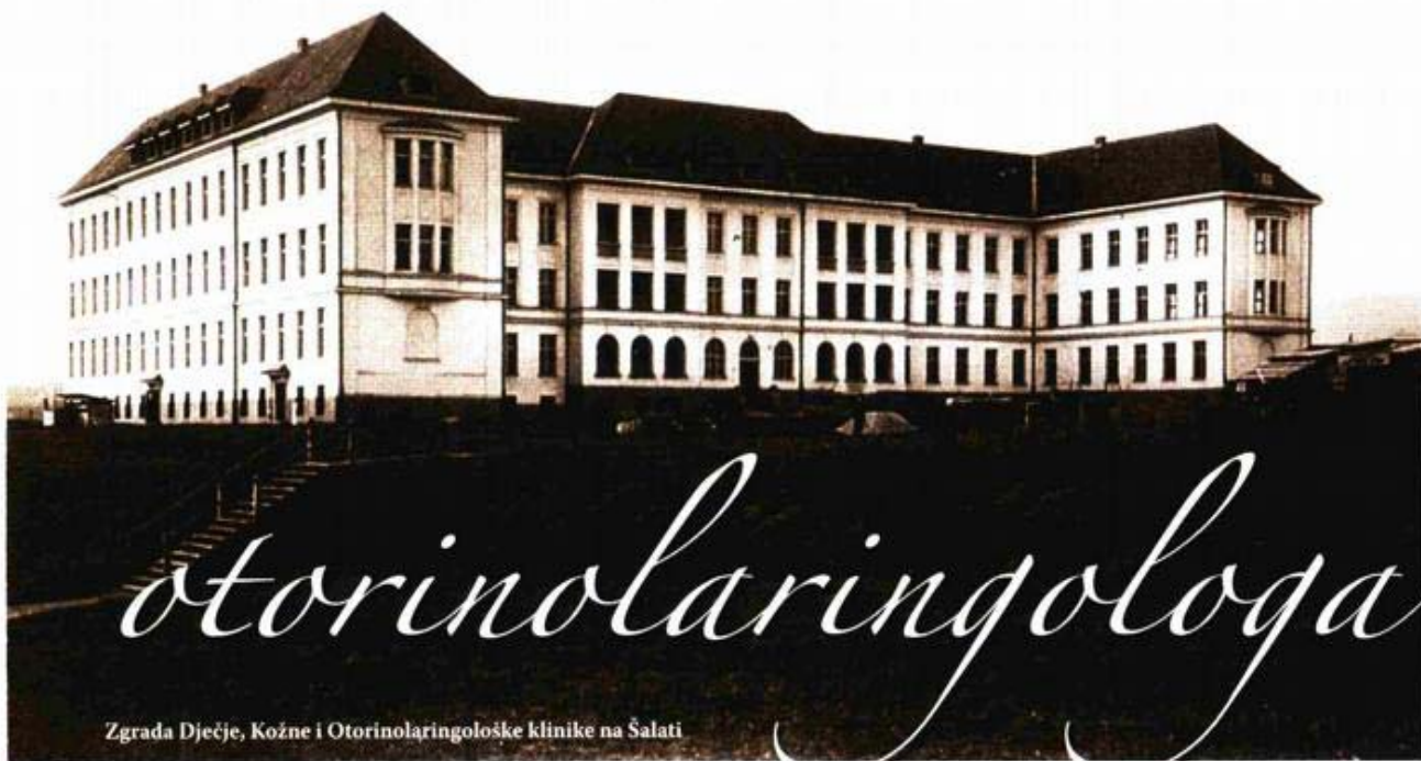
Zgrada Dječje, Kožne i Otorinolaringološke klinike na Šalati