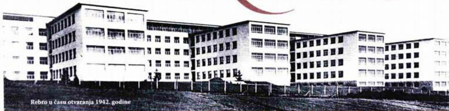
Rebro u času otvaranja 1942. godine

Zakladna bolnica na Rebru bila je najmodernija bolnica u jugoistočnoj Europi; bila je opća javna bolnica u vlasništvu Zaklade i pod nadzorom Ministarstva zdravstva