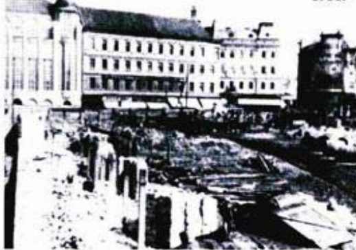
Srušena bolnica na Jelačićevom trgu 1931.

Početkom 1931. Zakladna je bolnica na Jelačićevu trgu srušena, a bolnica privremeno preseljena u prostor gradske ubožnice i Ortopedske bolnice na Svetom Duhu, dok se ne izgradi nova Zakladna bolnica. Na međunarodni natječaj za novu bolnicu, raspisan 19. srpnja 1930., pristiglo je čak 70 radova iz zemlje i inozemstva, među kojima je ocjenjivački sud izabrao devet - prvu je nagradu dobio arhitekt Ernest Weissmann. Među-