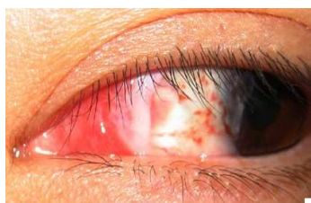
Stanje po eksciziji pterigija

Uzimanje slobodnog transplantata bulbarne spojnice da bi se prekrilo mjesto nastalog defekta