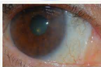
Šesti tjedan po operaciji pterigija